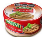
MOLTO PATE DE FOIE 90 GR