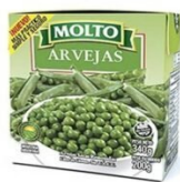
MOLTO ARVEJAS 340 GR