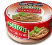
MOLTO PATE DE FOIE 90 GR