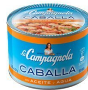
LA CAMPAGNOLA CABALLA EN ACEITE Y AGUA 300 GR