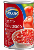
ARCOR TOMATE CUBETEO 400 GR