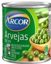
ARCOR ARVEJAS 320 GR $1,330.00