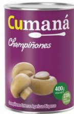
CUMANA CHAMPIÑONES ENTEROS 400 GR