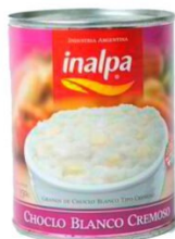
INALPA CHOCLO BLANCO CREMOSO 350 GR