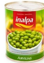
INALPA ARVEJAS 350 GR $760.00