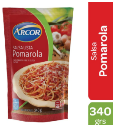
ARCOR SALSA POMAROLA 340 GR