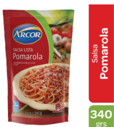
ARCOR SALSA POMAROLA 340 GR