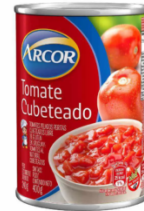
ARCOR TOMATE CUBETEO 400 GR