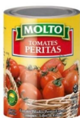
MOLTO TOMATE PELADO LATA 400 GR