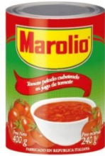
MAROLIO TOMATE CUBETEO 400 GR