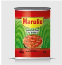
MAROLIO EXTRACTO DE TOMATE 150 GR