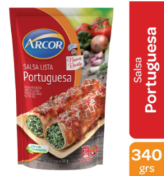
ARCOR SALSA PORTUGUESA 340 GR $1,350.00