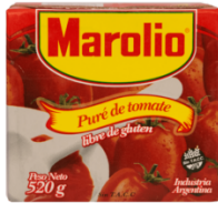
MAROLIO PURE DE TOMATE 520 GR