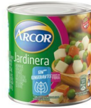
ARCOR JARDINERA 350 GR $1,370.00