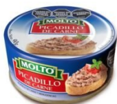
MOLTO PICADILLO DE CARNE 90 GR