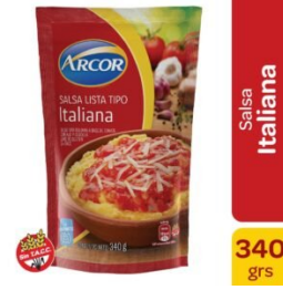
ARCOR SALSA ITALIANA 340 GR