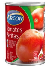
ARCOR TOMATE EN LATA 400 GR