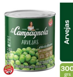
LA CAMPAGNOLA ARVEJAS 320 GR