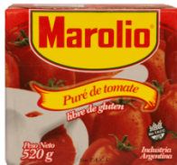
MAROLIO PURE DE TOMATE 520 GR