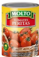
MOLTO TOMATE PELADO LATA 400 GR