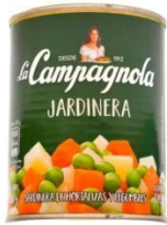
LA CAMPAGNOLA JARDINERA 350 GR $1,770.00