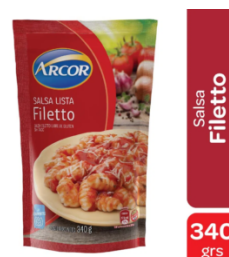
ARCOR SALSA FILETTO 340 GR