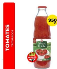
DEL VALLE TOMATE TRITURADO 910 GR