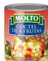
MOLTO COCTEL DE 4 FRUTAS 820 GR