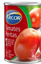
ARCOR TOMATE EN LATA 400 GR