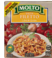
MOLTO SALSА FILETTO 360 GR