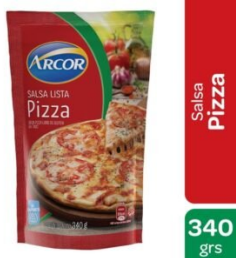
ARCOR SALSA PIZZA 340 GR