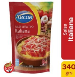
ARCOR SALSA ITALIANA 340 GR