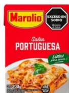
MAROLIO SALSA PORTUGUESA 200 GR