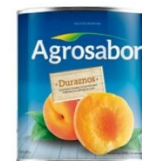
AGROSABOR DURAZNO EN MITADES 820 GR