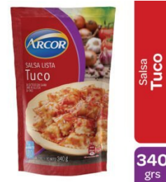
ARCOR SALSA TUCO 340 GR $1,350.00