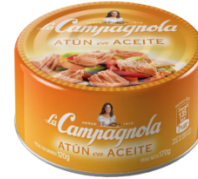
LA CAMPAGNOLA ATUN EN ACEITE 170 GR