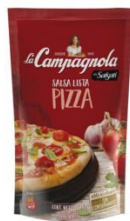
LA CAMPAGNOLA SALSА PIZZA 340 GR