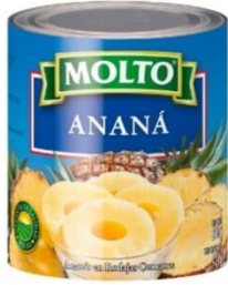
MOLTO ANANA EN RODAJAS 565 GR