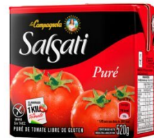
SALSATI PURE DE TOMATE 520 GR