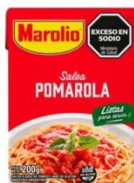
MAROLIO SALSA POMAROLA 200 GR