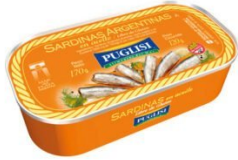
PUGLISI SARDINAS EN ACEITE 120 GR