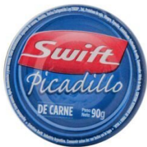
SWIFT PICADILLO DE CARNE 90 GR $1,030.00