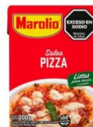
MAROLIO SALSA PIZZA 200 GR