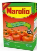
MAROLIO TOMATE TRITURADO 500 GR