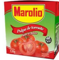
MAROLIO PULPA DE TOMATE 520 GR