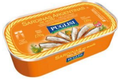
PUGLISI SARDINAS EN ACEITE 120 GR