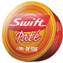
SWIFT PATE DE FOIE 90 GR