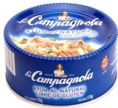
LA CAMPAGNOLA ATUN AL NATURAL 170 GR