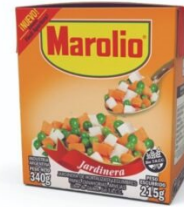
MAROLIO JARDINERA 340 GR