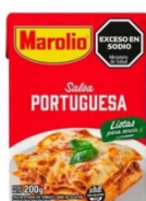
MAROLIO SALSA PORTUGUESA 200 GR