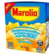
MAROLIO DURAZNO AL NATURAL 205 GR