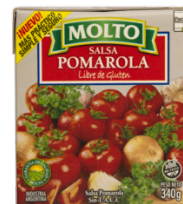
MOLTO SALSA POMAROLA 340 GR