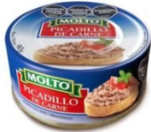
MOLTO PICADILLO DE CARNE 90 GR