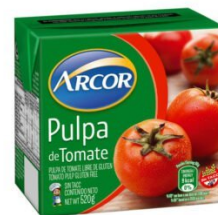
ARCOR PULPA DE TOMATE 520 GR