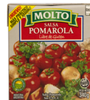
MOLTO SALSA POMAROLA 340 GR