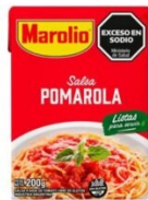
MAROLIO SALSA POMAROLA 200 GR